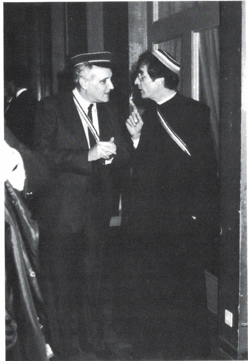
Der einstige Senior der Subsilvania und der jetzige Sektionsgötti